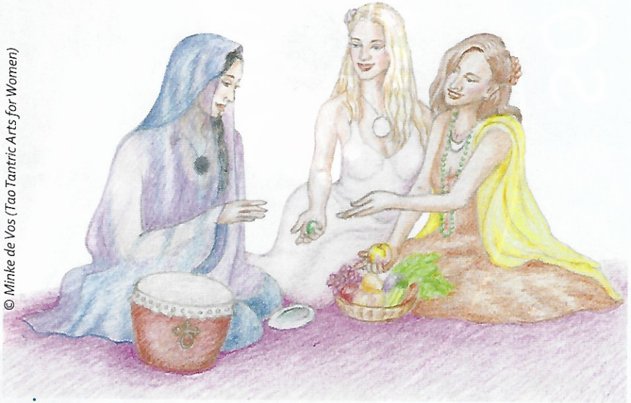
Les trois initiatrices de l'Empereur Jaune : la Dame Blanche révélant les secrets de l'Oeuf de Jade à la Fille Mystérieuse et la Fille des Moissons

© Minke de Vos (Tao Tantric Arts for Women)